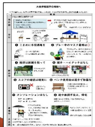
別紙2「大会参加の皆様へ」 受付、試合方法などが記載されています。 必ずご覧いただき、会場へお越しください。