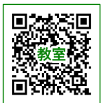
教室ページの画面